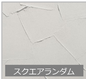
スクエアランダム