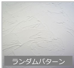
ランダムパターン